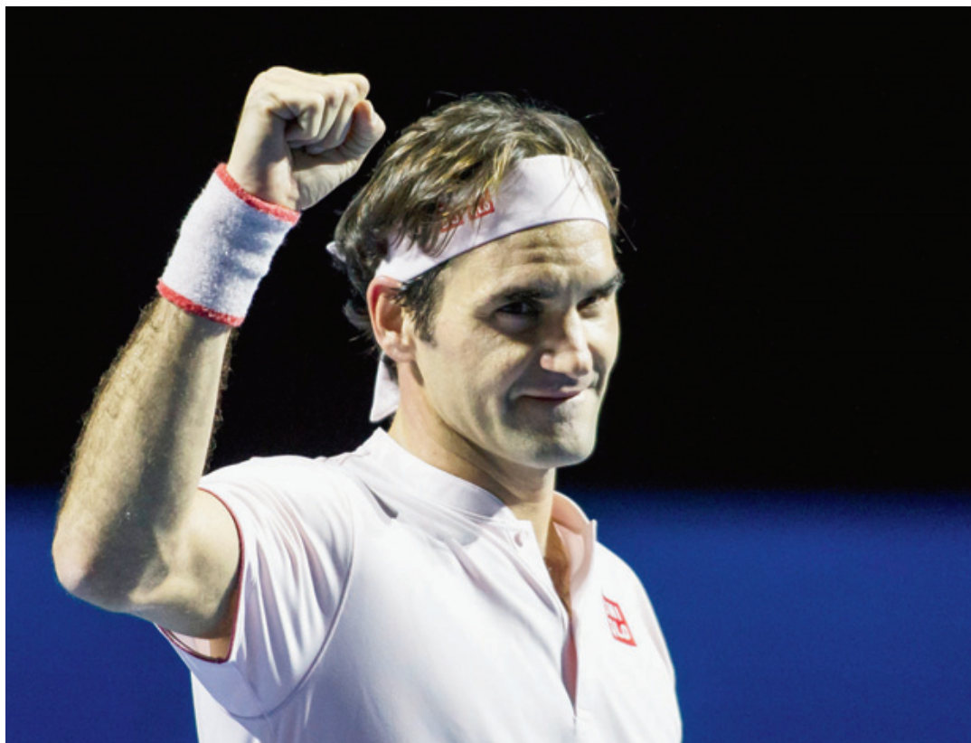
Roger Federer devra élever son niveau de jeu s'il entend cueillir un neuvième titre à Bâle.