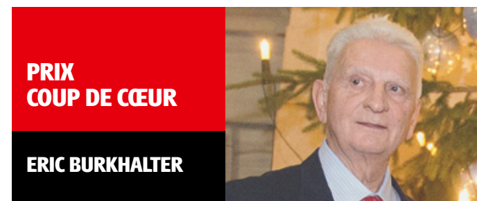
PRIX COUP DE CŒUR