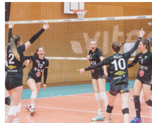
PRIX DE L'ÉQUIPE DE L'ANNÉE NUC M17 VOLLEYBALL