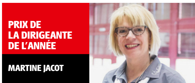
PRIX DE LA DIRIGEANTE DE L'ANNÉE

Équipe de l'année: 1. NUC M17, 1292 pts. 2. JC Cortaillod-NE Dames, 980 pts. 3. Neuchâtel Xamax FCS, 954 pts. 4. HC La Chaux-de-Fonds, 668 pts. 5. TC Neuchâtel - Ligue A, 636 pts.