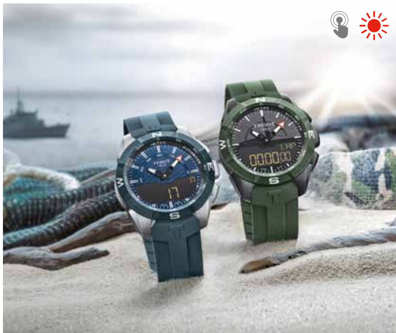
TISSOT T-TOUCH EXPERT SOLAR II

Le design de la Tissot T-Touch Expert Solar lui permettra de se fondre dans l'environnement comme un véritable camouflage. Elle existe en version vert armée avec une rose des vents dans la partie supérieure du cadran, idéale pour vous aventurer sur la terre ferme. Le modèle bleu marine, doté d'index bâtons doubles sur un fond pointillé qui contraste avec les lignes figurant au-dessus du centre du cadran, affiche un indicateur des minutes. Il vous accompagnera dans toutes vos sorties en mer. Les deux modèles affichent des lunettes en céramique inrayable et une rose des vents lumineuse. En outre, grâce à leur boîtier en titane, ces montres sont extra-légères et hypoallergéniques.